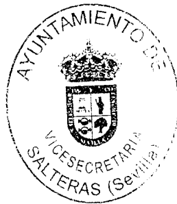
Rocío Huertas Campos